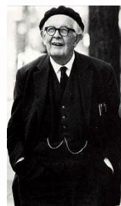
Piaget (desarrollo cognitivo)